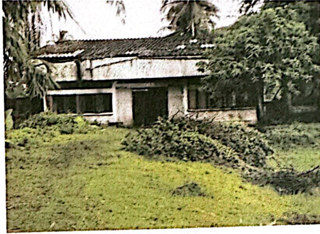
อาคารเรียนอเนกประสงค์