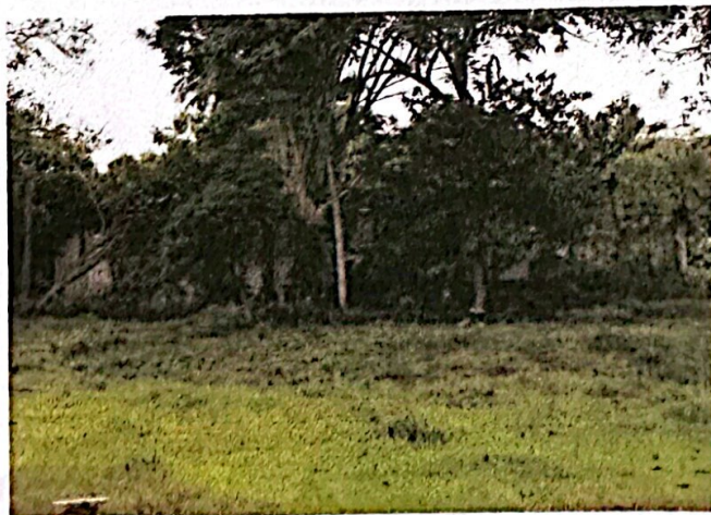
อาคารเรียน ๒ ห้อง